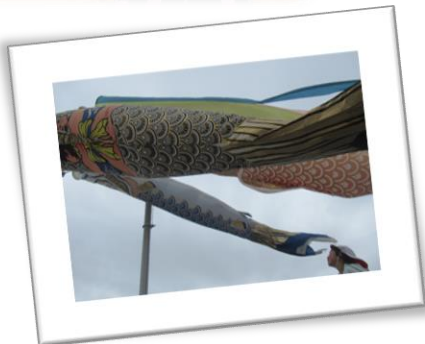
屋根より高い♪こいのぼり~