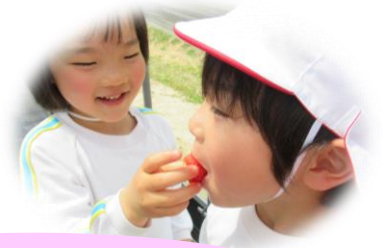
いちご狩りに行ったよ🍓