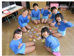
優勝目指してがんばるよ!!