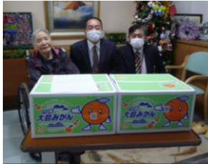
J A 山口県様 12月22日 みかん寄贈