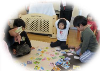
お手付きしちゃった~