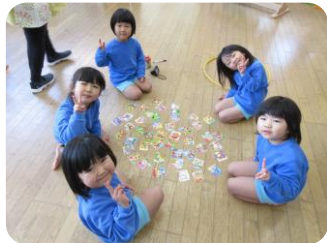
寺ら寺ら・わくわく・いきいきぐみ