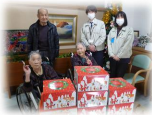
平生町職員組合の皆様 12月22日 ケーキ寄贈