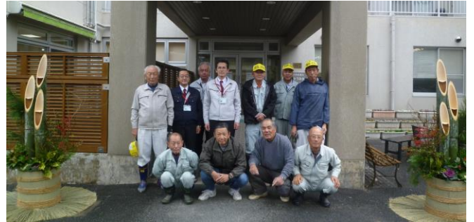
門松づくりの皆様 12月16日 匠の技！